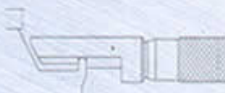
测量喷雾罐 For sprayer cans